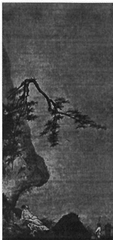
Ма Юань. Лунный свет. Живопись тушью на шелке. XII—XIII вв.