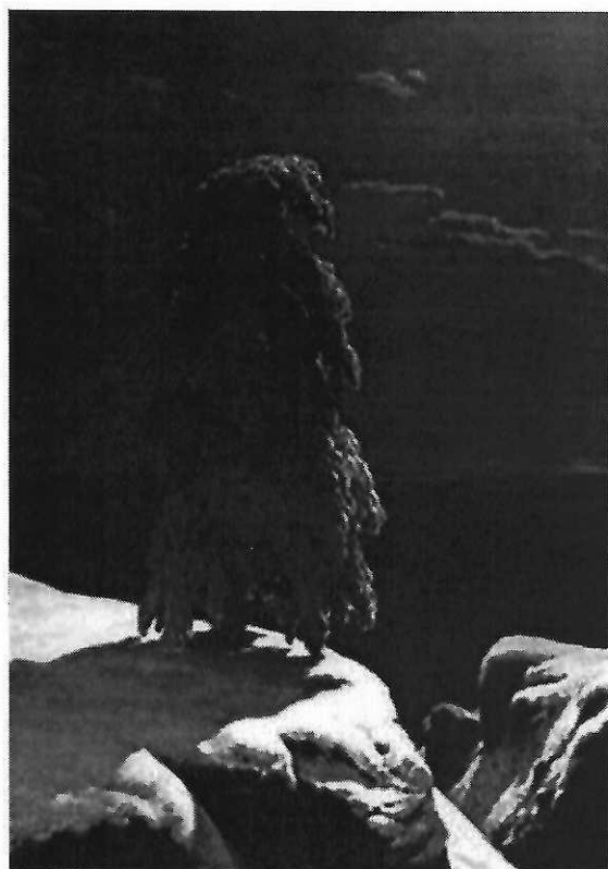
Иван Шишкин. На Севере диком... 1891

Такие задания направлены на выявление специальных предметных компетенций участников. В процессе выполнения задания необходимо провести анализ произведения, выявить его художественную идею, определить средства ее реализации. В задании может быть предусмотрено проведение сравнительно-сопоставительного анализа разнородных (полярных) явлений художественной культуры. Участники олимпиады должны продемонстрировать понимание принадлежности произведения искусства той или иной национальной культуре, эпохе, художественной школе, стилю.